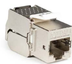
Jack Cat 6A blindado OPCAJPC6A