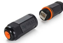
Acoplador industrial CAT6A blindado OPCAINWIP68C6A