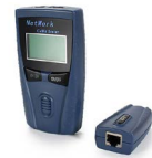
Probador cables de red OPEMPUTP