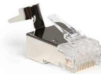
Plug blindado RJ45 Cat6 & 6A aislamientos 1.5 mm OPCAJRJ45B66A15