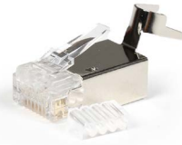
Plug blindado RJ45 Cat6 & 6A aislamientos 1.2 mm OPCAJRJ45B66A12